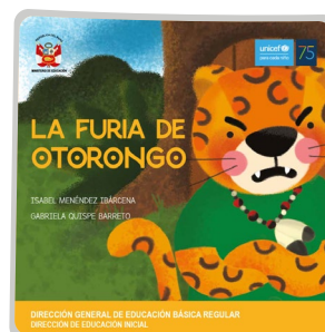
La furia de Otorongo