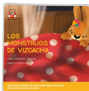
Los monstruos de Vizcacha

https://tinyurl.com/losmonstruosdevizcacha