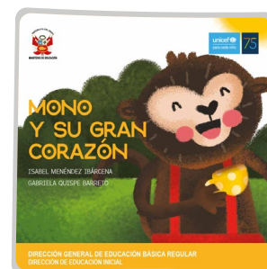
Mono y su gran corazón

https://tinyurl.com/losmonstruosdevizcacha