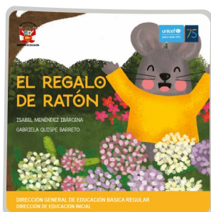
El regalo de Ratón

Te presento los cuentos elaborados desde el MINEDU y que se encuentran alojados en su repositorio: