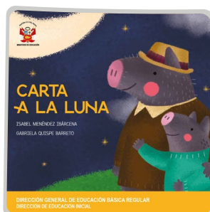
Carta a la luna